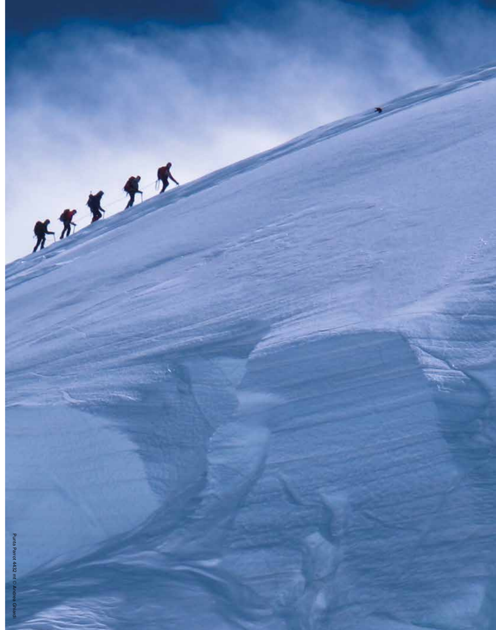
Punta Parrot 4432 mt