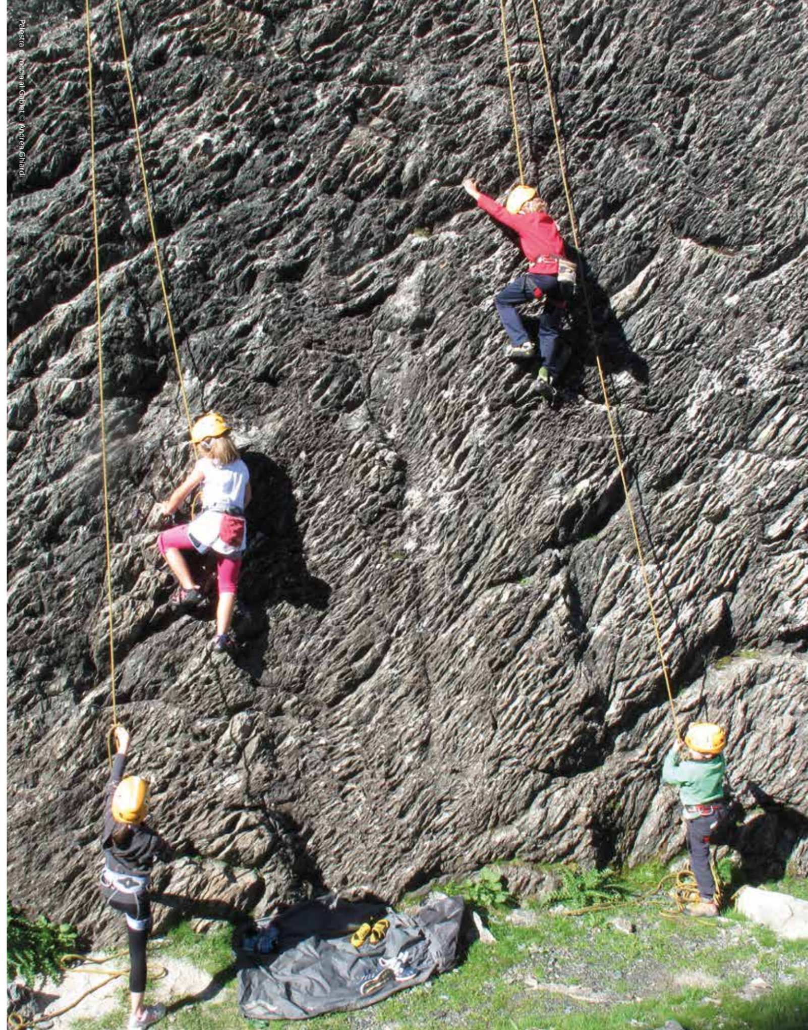
Palestra di roccia al Gabiet

Il prezzo non comprende: il costo degli impianti di risalita, tutti i pernottamenti e pranzi ai rifugi e tutto quanto non specificatamente contemplato.