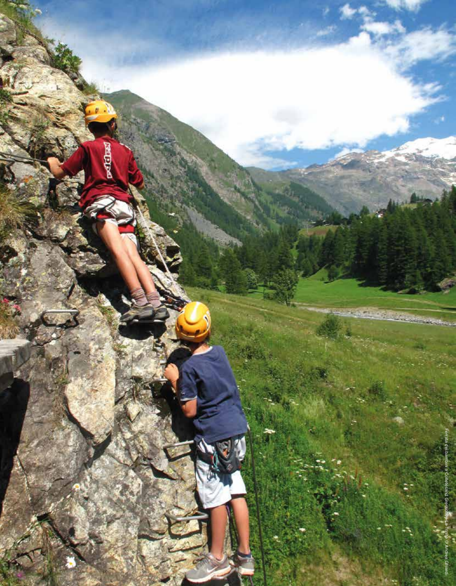
Ferrata dei bambini a Collesand Gressoney-La-Trinité

“provare” l’arrampicata sportiva moderna, sia su vie facili che su vie più impegnative anche di più “tiri di corda”.