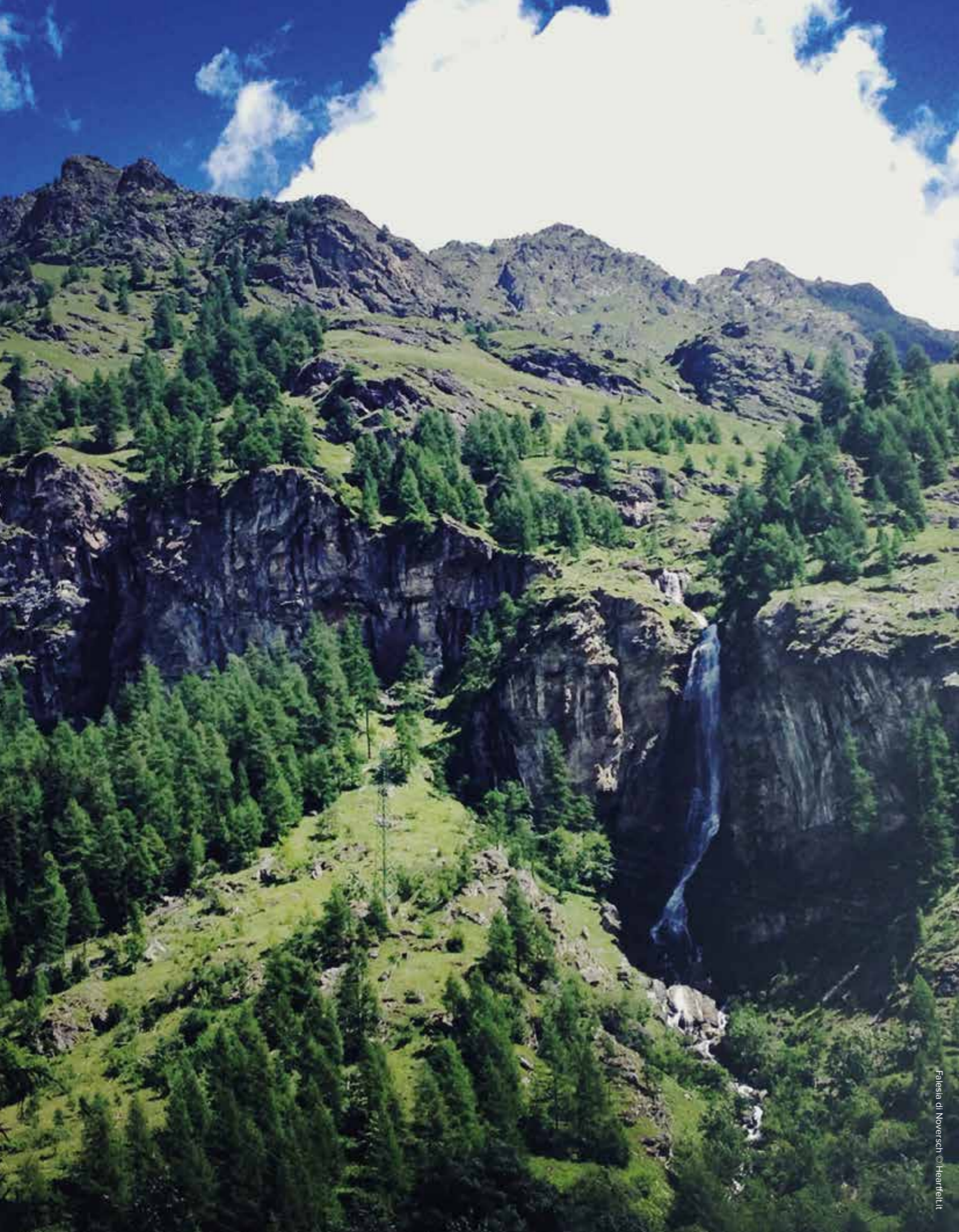
Falesia di Noversch